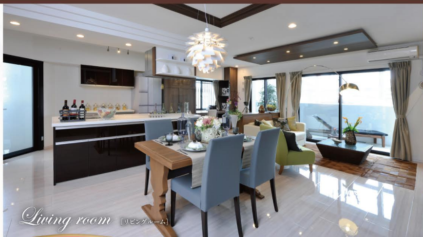
Living room (リビングルーム)