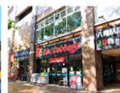
レッドキャブツ 八幡駅前店...750m (徒歩約10分)