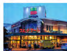
スピナートさくら通り店...140m (徒歩約2分)