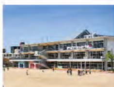
花尾小学校...70m (徒歩約1分)