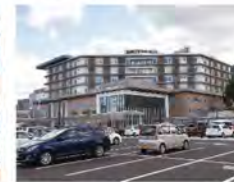
北九州市立八幡病院...500m (徒歩約7分)

*表示距離については現地からの地図上の概測距離を、徒歩分数表示については80mを徒歩1分として算出(端数切り上げ)したものです。車による所要時間は時速40kmで計算していますが、道路状況などにより多少異なる場合もあります。