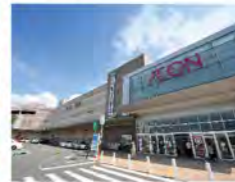
イオンモール八幡東...2.5km (車で約4分)