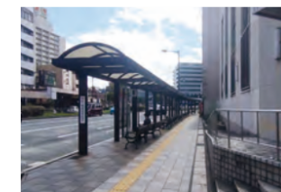
唐戸バス停 徒歩約2分(約150m)