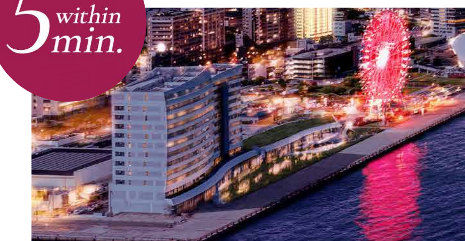
星野リゾート リゾナーレ下関

2025年12月「星野リゾートリゾナーレ下関」開業予定。 地元だけではなく、観光客からも愛されるエリアに発展していきます。