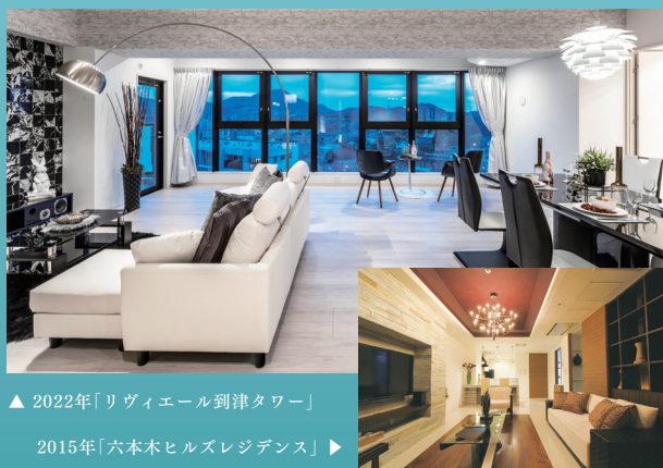
▲ 2022年「リヴィエール到津タワー」