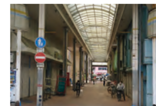
唐戸商店街 徒歩約5分(350m)