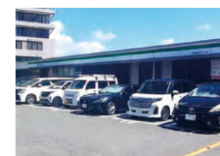
ファミリーマート 徒歩約4分(約300m)