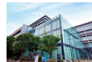
下関市役所 徒歩約3分(約230m)