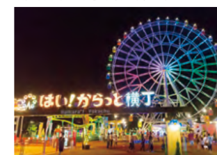
はい!からっと横丁 徒歩5分(約400m)