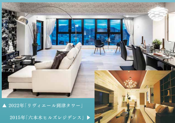
▲ 2022年「リヴィエール到津タワー」