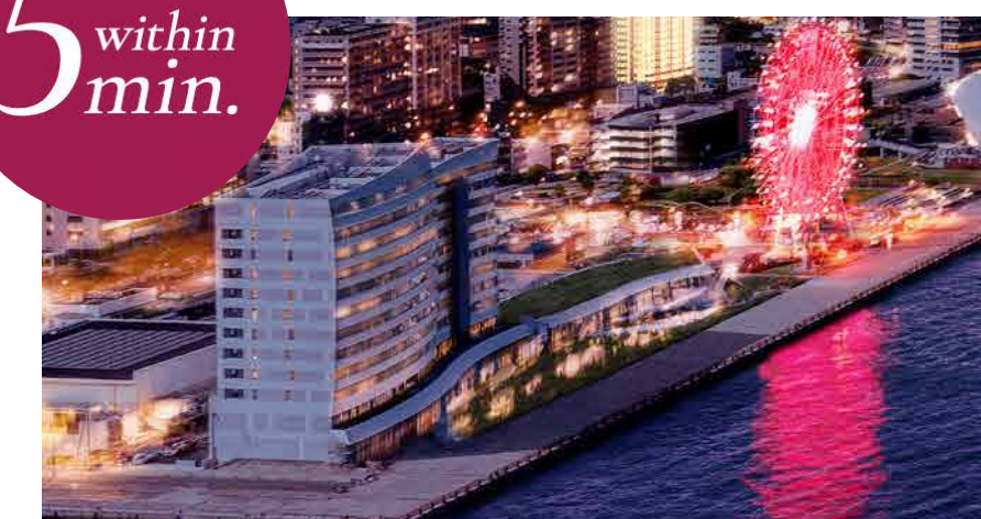
星野リゾート リゾナーレ下関

2025年12月「星野リゾートリゾナーレ下関」開業予定。 地元だけではなく、観光客からも愛されるエリアに発展していきます。