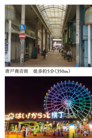
はい!からっと横丁 徒歩5分(約400m)