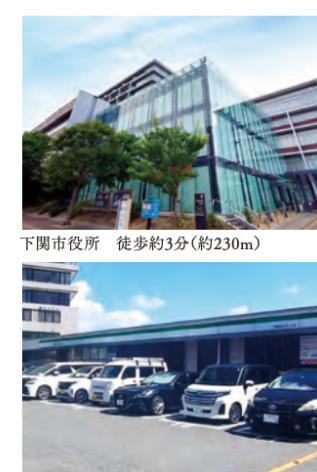
ファミリーマート 徒歩約4分(約300m)