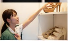
下足箱とシューズクローク