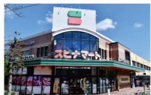
スピナマート さくら通り店 …180m (徒歩約3分)