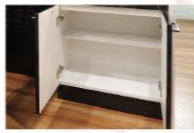
ダイニング側のキッチン収納