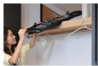
ファミリークローゼット

無駄をなくし、適材適所の収納スペースを設けました。頑張って片付けなくても自然と綺麗な状態をキープできます。