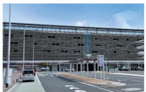
JR八幡駅 …680m (徒歩約9分)