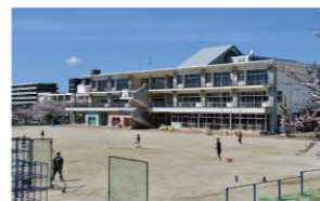
北九州市立花尾小学校 …200m (徒歩約3分)